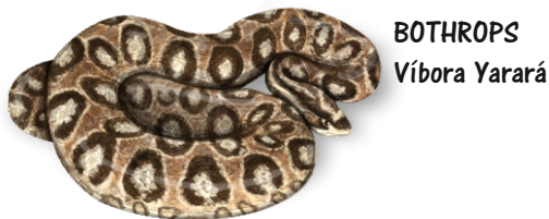
BOTHROPS Víbora Yarára