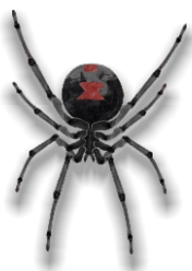
Viuda Negra o Latrodectus