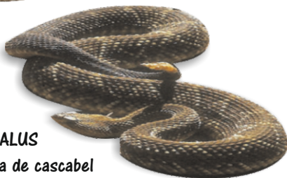
CROTALUS Víbora de cascabel