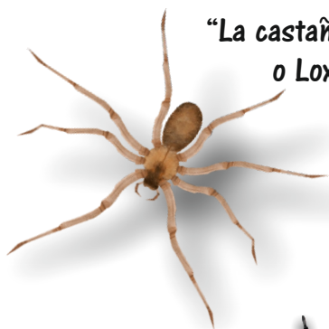
“La castaña doméstica” o Loxosceles laeta